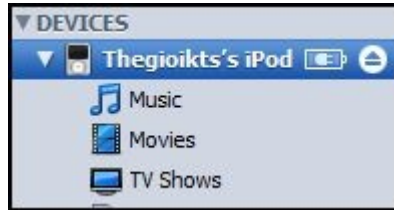
Phần quản lý Ipod của bạn

3. Chép Video vào Ipod : bạn cứ làm tương tự là ok .